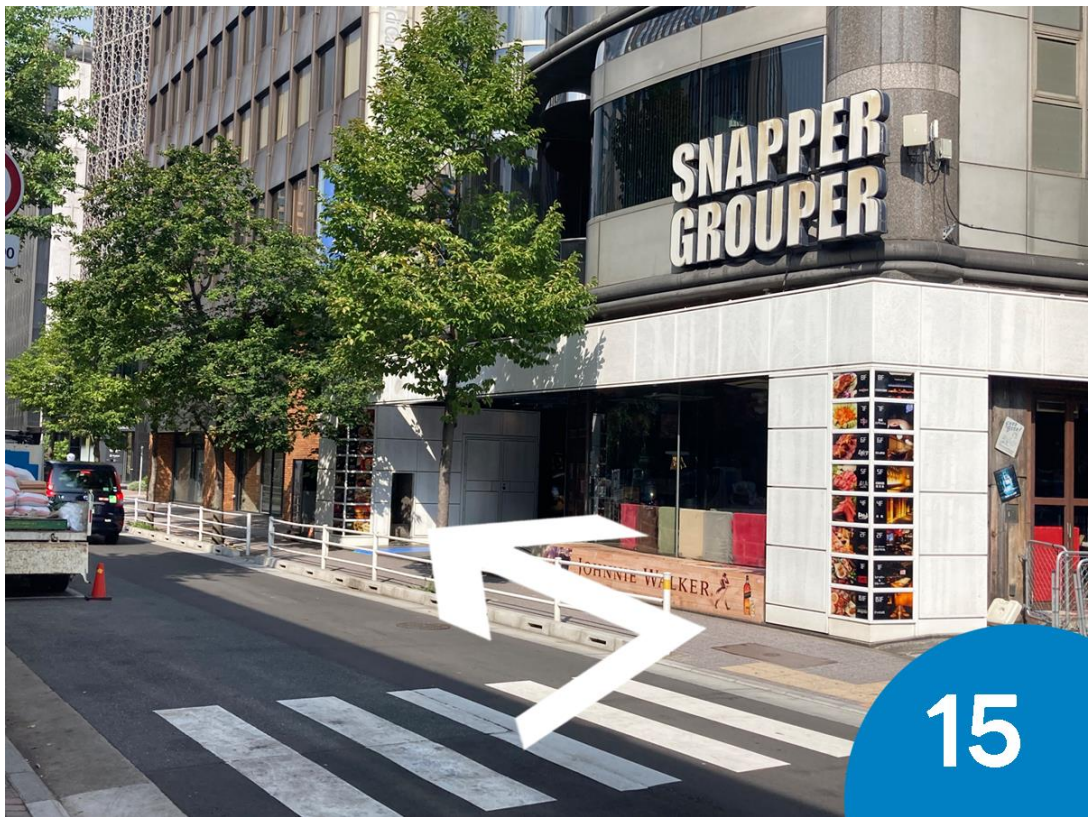
15. 横断歩道を渡り左折します。