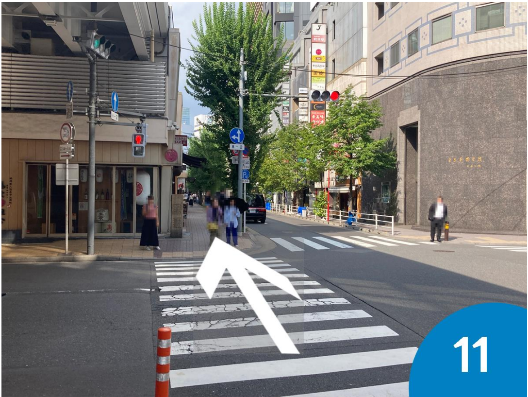
11. 横断歩道を渡ります。