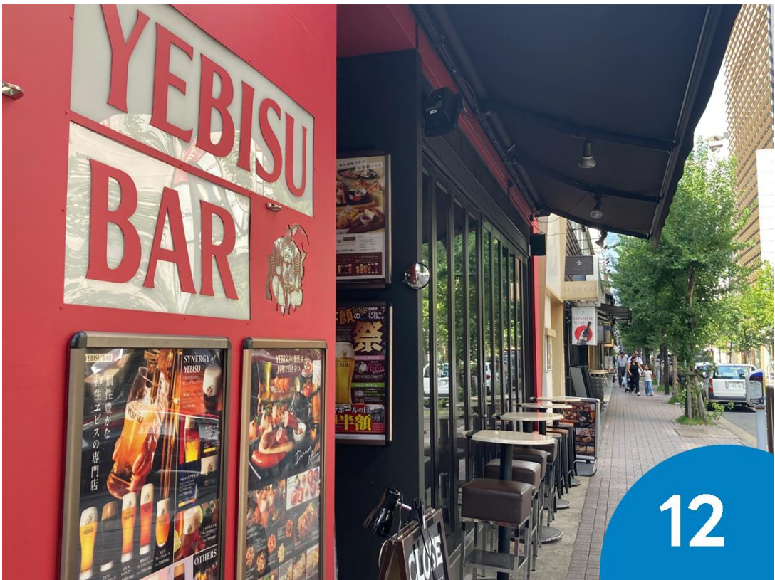
12. 「YEBISU BAR（エビスバー）」を通過します。