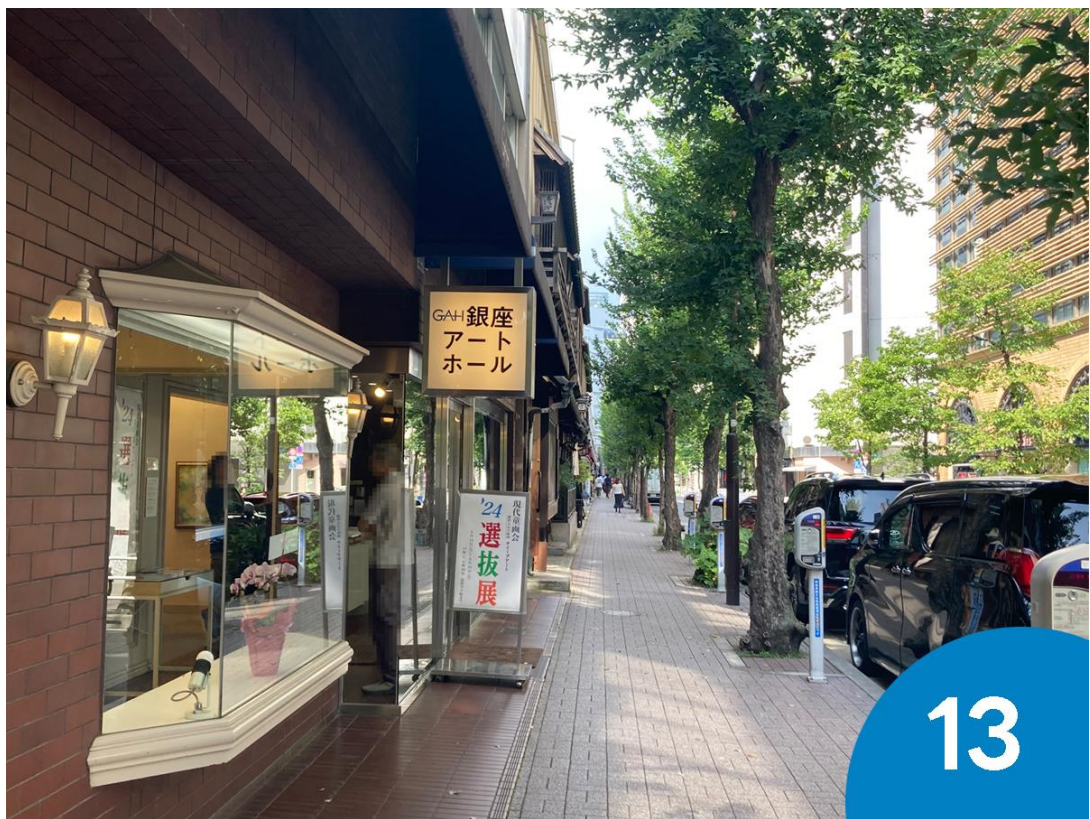
13. 「銀座アートホール」を通過します。