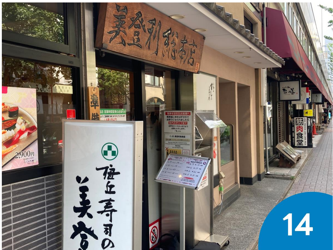
14. 「梅丘寿司の美登利」を通過します。