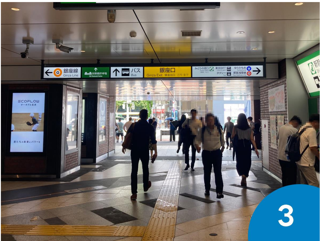
3. 銀座口に向かいます。