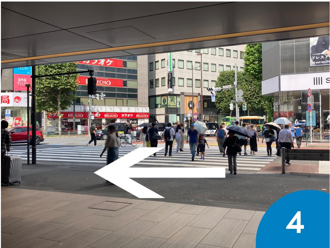
4. 銀座口を出たら横断歩道を渡らずに左折、高架下沿いを直進します。