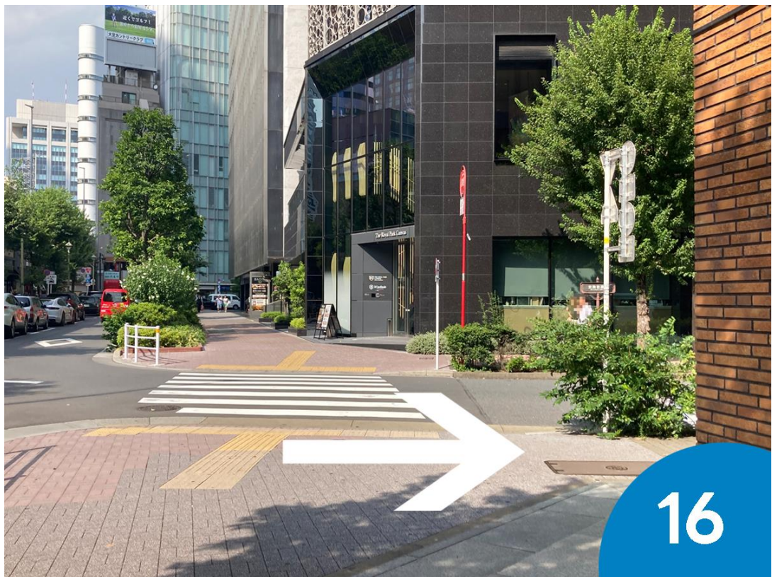
16. 1つめの角を右折します。